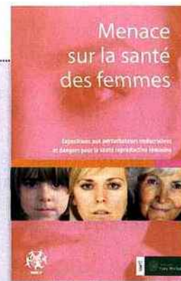
Menace sur la santé des femmes Expositions aux perturbateurs endocriniens et dangers pour la santé reproductive féminine 136 pages - 11 € Editions Yves Michel