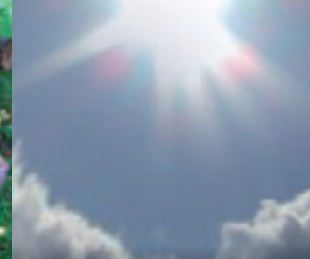
Pour une énergie saine