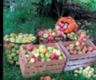
Pour la biodiversité