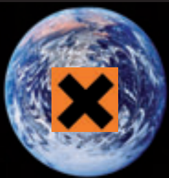
Pour un avenir sans toxiques