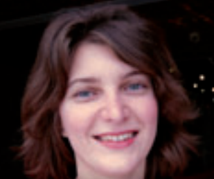
Pour plus de justice